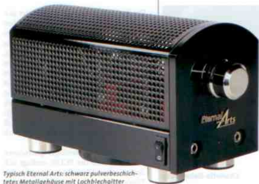
Typisch Eternal Arts: schwarz pulverbeschichtetes Metallgehäuse mit Lochblechgitter

Wie bei Eternal Arts üblich, geriet die Typenbezeichnung spartanisch bis nicht existent: Die Maschine heißt schlicht „OTL-Kopfhörerverstärker“ und kostet nicht ganz so schlichte 2.750 Euro. Dafür gibt's ein piekfein glänzend schwarz gepulvertes Gehäuse mit sanft gerundetem Lochblechdach, einem Paar Cinch-Eingänge, einem satt laufenden Pegelsteller und zwei Klinkenbuchsen zum Anschluss zweier Kopfhörer. Dabei allerdings gibt es ein paar Besonderheiten zu beachten: Das Gerät kommt nicht mit jedem Kopfhörer zurecht, und schon mal gar nicht mit zweien davon im Parallelbetrieb. Der Grund dafür ist einsichtig und im Kürzel „OTL“ verborgen: Die Schaltung ist ein Röhrenverstärker ohne Ausgangsübertrager (output transformerless) und kann von daher nur eine begrenzte Menge Strom liefern. Wir erinnern uns: Bei üblichen Röhrenverstärkern dient jener Übertrager der Energietransformation aus dem Röhrenuniversum (hohe Spannungen, geringe Ströme) in die Lautsprecherwelt (geringe