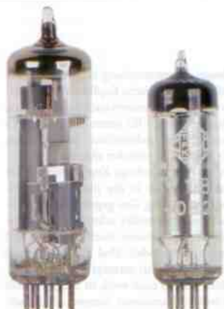
Links die Signalaröhre PCL86, rechts die Stabilisatorröhre STV 108/30