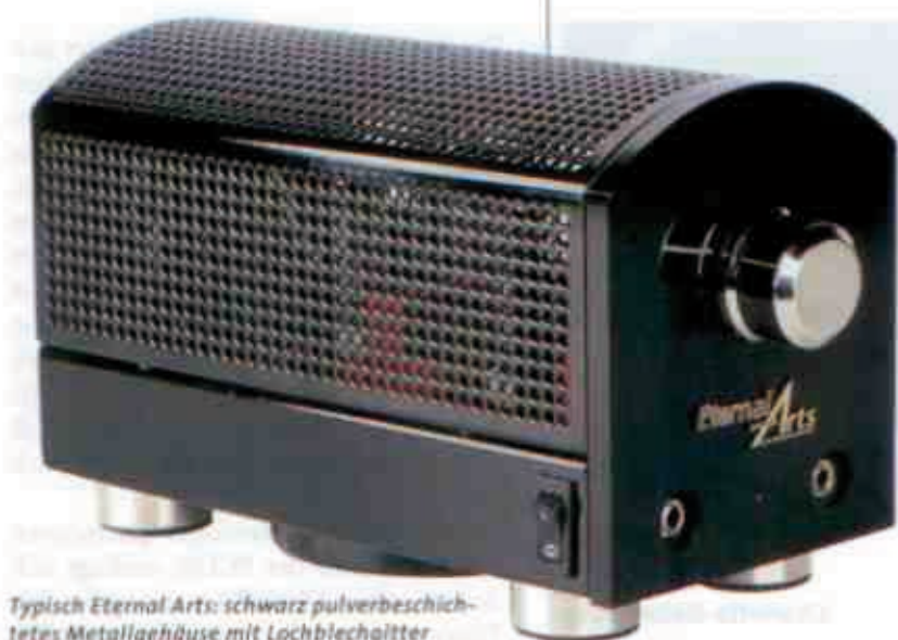
Typisch Eternal Arts: schwarz pulverbeschichtetes Metallgehäuse mit Lochblechgitter

Wie bei Eternal Arts üblich, geriet die Typenbezeichnung spartanisch bis nicht existent: Die Maschine heißt schlicht „OTL-Kopfhörerverstärker“ und kostet nicht ganz so schlichte 2.750 Euro. Dafür gibt's ein piekfein glänzend schwarz gepulvertes Gehäuse mit sanft gerundetem Lochblechdach, einem Paar Cinch-Eingänge, einem satt laufenden Pegelsteller und zwei Klinkenbuchsen zum Anschluss zweier Kopfhörer. Dabei allerdings gibt es ein paar Besonderheiten zu beachten: Das Gerät kommt nicht mit jedem Kopfhörer zurecht, und schon mal gar nicht mit zweien davon im Parallelbetrieb. Der Grund dafür ist einsichtig und im Kürzel „OTL“ verborgen: Die Schaltung ist ein Röhrenverstärker ohne Ausgangsübertrager (output transformerless) und kann von daher nur eine begrenzte Menge Strom liefern. Wir erinnern uns: Bei üblichen Röhrenverstärkern dient jener Übertrager der Energietransformation aus dem Röhrenuniversum (hohe Spannungen, geringe Ströme) in die Lautsprecherwelt (geringe