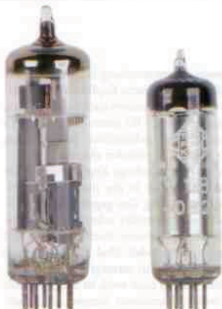
Links die Signalaröhre PCL86, rechts die Stabilisatorröhre STV 108/30

Von Eternal-Arts-Verstärkern sind wir's gewohnt, und der Kopfhörer-Amp macht da keine Ausnahme: Totenstille. Ohne Signal am Eingang herrscht absolute Ruhe auf den Ohren, bei Anschluss einer Signalquelle hört man deren Rauschen und Brummen – sonst nichts. Wie Burkhardt Schwäbe das bei Röhrengeräten mit eingebautem Netzteil immer wieder hinbekommt, verdient allerhöchsten Respekt.