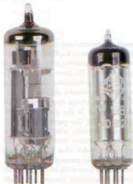
Links die Signalaröhre PCL86, rechts die Stabilisatorröhre STV 108/30